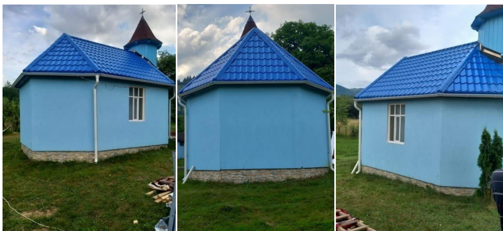
Renovarea Bisericii de la reședința din Rodna, Bistrița Năsăud